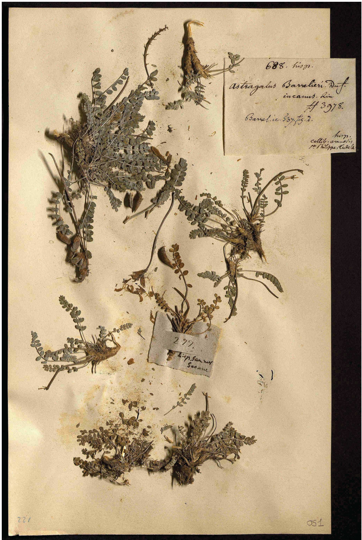
Fig. 4. Pliego de herbario que contiene el lectotipo de Astragalus barrelieri Dufour (BORD, Herbar Léon Dufour 5.4.051).