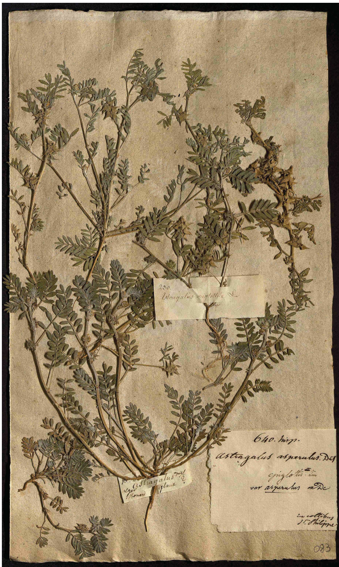
Fig. 3. Pliego de herbario que contiene el lectotipo de Astragalus asperulus Dufour (BORD, Herbario Léon Dufour 5.4.083).