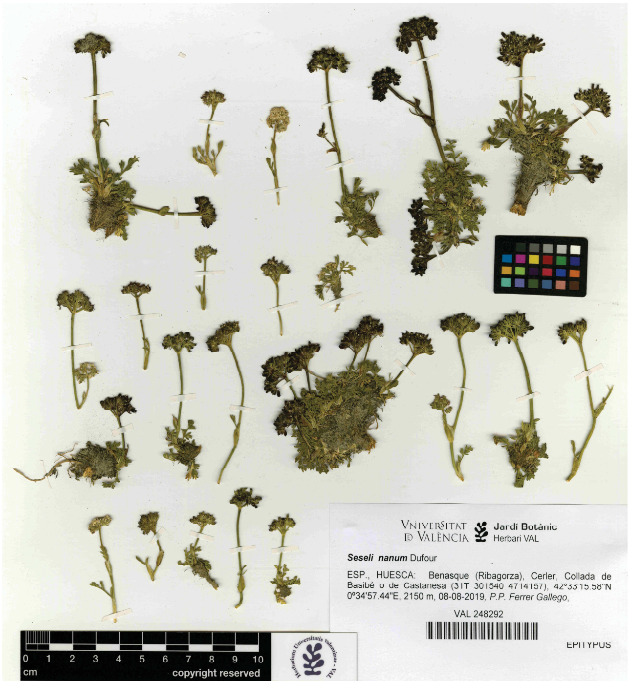
Fig. 2. Epitipo de Seseli nanum Dufour (VAL 248292) (imagen cortesía del herbario VAL, reproducida con permiso).