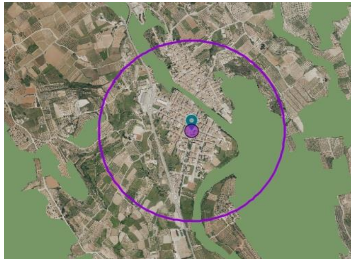
Imagen 1.- Emplazamiento 1. Círculo morado: área de 500 metros alrededor del emplazamiento. En verde: terreno forestal.

Queda totalmente prohibida la utilización de globos chinos, farolillos voladores, globos de luz, velas flotantes, linternas voladoras u otros dispositivos similares dado el elevado nivel de riesgo que comporta una llama sin dirección ni control alguno, a merced del viento, y que puede alejarse y caer en una zona forestal o en cualquier otro lugar susceptible de iniciar un incendio forestal.