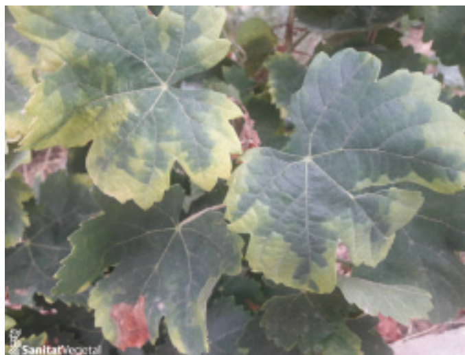
Sintomatología de mosquito verde en hoja de variedad blanca

En las nuevas plantaciones y/o injertadas se deberá extremar la precaución, ya que los daños ocasionados por esta plaga podrían ser considerables.