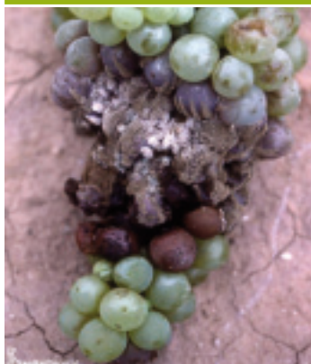
Foco de botritis en uva blanca ocasionado por las heridas de la polilla del racimo

Confusión sexual: En aquellas zonas donde el nivel de plaga ha sido normal, se han obtenido resultados significativamente satisfactorios en aquellos núcleos de parcelas en los que se ha practicado la técnica de la confusión sexual.