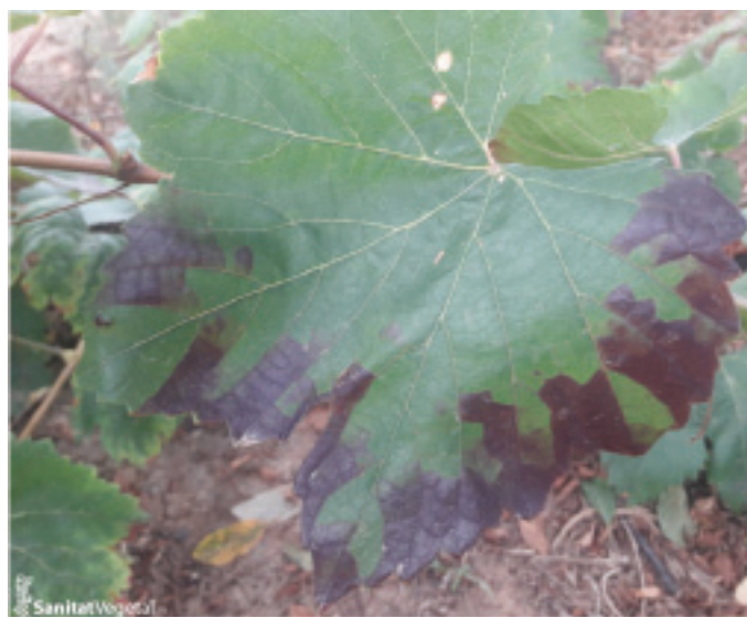
Sintomatología de mosquito verde en hoja de variedad tinta