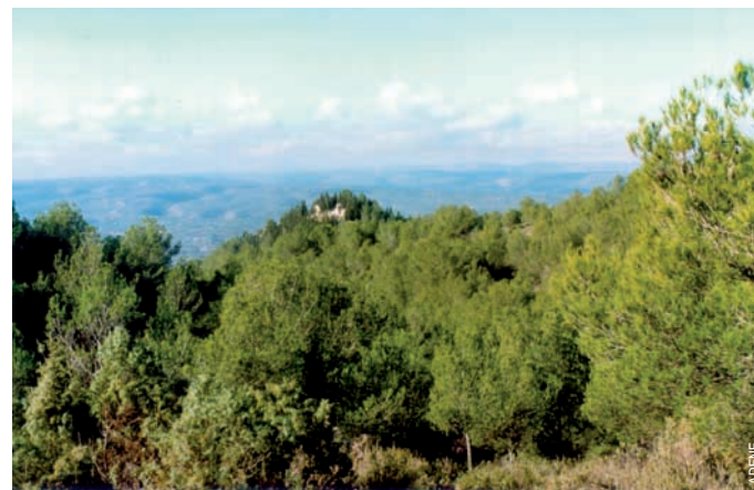
Castillo de Enguera