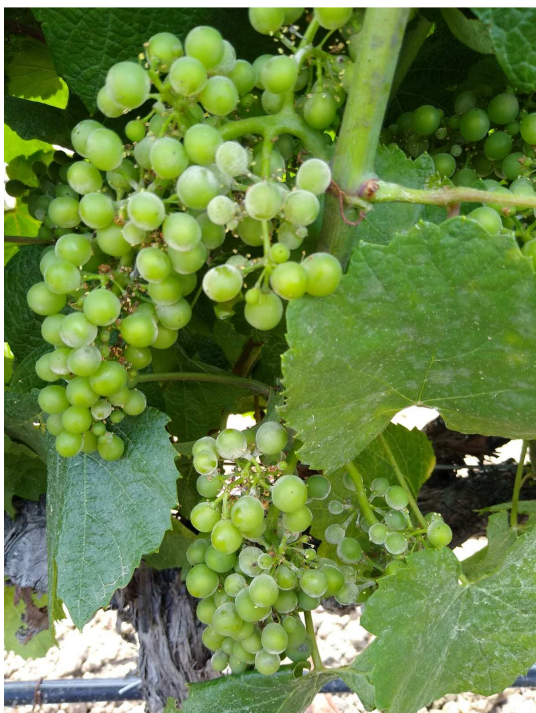
Atac d'oidi en raïm

Ens trobem en un període de màxima sensibilitat a l'atac d'aquest fong, per la qual cosa es recomana continuar mantenint la protecció enfront d'aquesta malaltia. Una vegada s'aconsegueixca l'estat fenològic de "Verol", es podrà considerar finalitzada la protecció contra aquesta malaltia, sempre que, la parcel·la es trobe lliure de símptomes d'aquest paràsit.