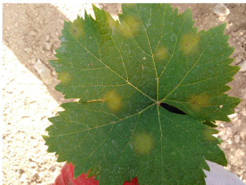
Simptomes de míldiu en fulla. Taques d'oli actives

En aquests moments les condicions meteorològiques han millorat considerablement, per la qual cosa el risc d'atac de míldiu s'ha reduït d'una manera notable. Malgrat això, en aquelles parcel·les en les quals la malaltia no ha sigut controlada de manera totalment satisfactòria, (taques d'oli encara actives, amb conidis), es recomana realitzar un tractament fungicida per a detindre l'atac d'aquest fong.