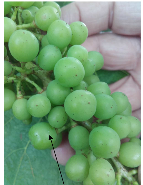
Ou de cuc de raïm recentment posat

Per això, des del Servei de Sanitat Vegetal es recomana realitzar un tractament insecticida contra aquesta plaga. Aquest tractament se situarà entre els dies 22 i 27 de juny, tots dos inclosos.