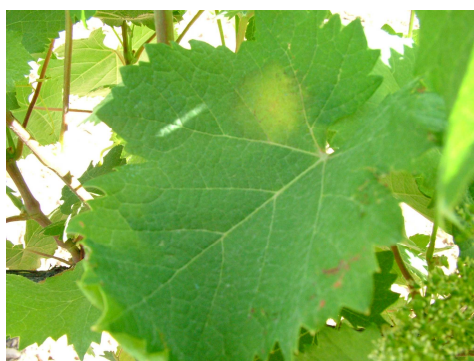
Típica taca d'oli sobre fulla, trampolí per a noves contaminacions

Continuen observant-se símptomes de la malaltia en qualsevol òrgan verd de les plantes. Davant l'amenaça de noves precipitacions i per la quantitat d'inòcul de la malaltia present en l'ambient, recomanem seguir amb la protecció de la vinya enfront d'aquest fong. Es recomana la utilització de productes "Penetrants" o de "Fixació a les Ceres Cuticulars".