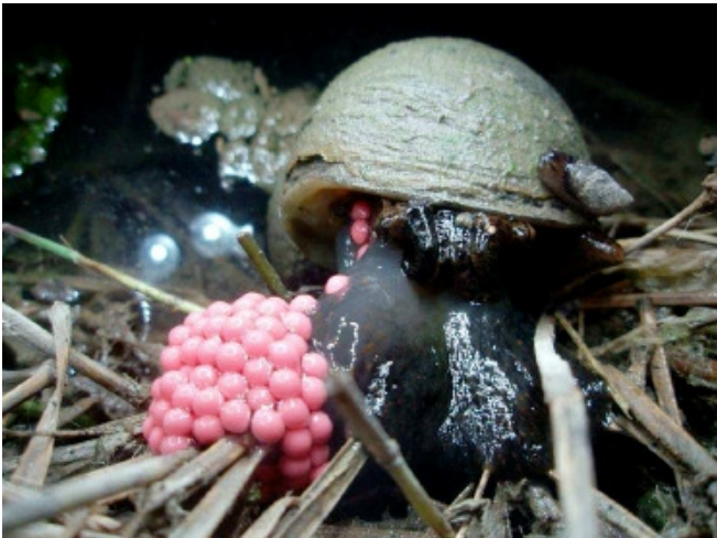
Femella adulta i ous de Pomacea insularum

Els caragols poma són mol·luscos gasteròpodes del gènere Pomacea , família Ampulariidae . originaris d'Amèrica del Sud. Es tracta d'espècies aquàtiques d'aigua dolça amb gran capacitat d'adaptació. A Espanya es troba l'espècie Pomacea insularum . Va ser detectat per primera vegada en 2009 i s'ha estès pel delta de l'Ebre. Esta espècie esta considerada com una de les 100 espècies invasores més perjudicials.