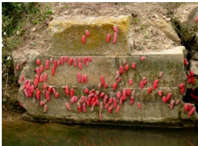
Posta en estructura de formigó en el marge del riu (GenCat)

Foto: Protocol prospecció Pomacea (MAGRAMA)