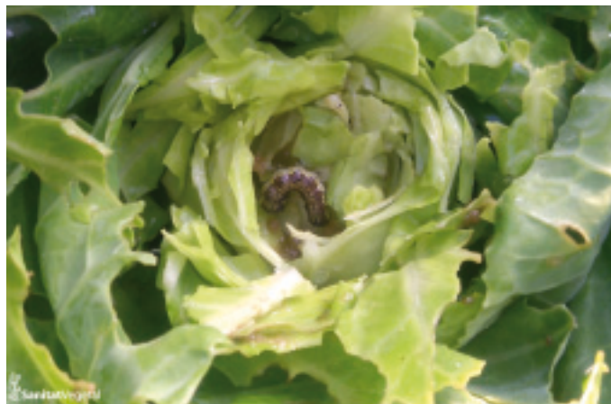
Detall de presència i danys de Spodoptera littoralis en col

Erugues ( Spodoptera littoralis , Spodoptera exigua , Helicoverpa armigera , Plutella sp , Pieris brassicae , Plusia chalcites ).